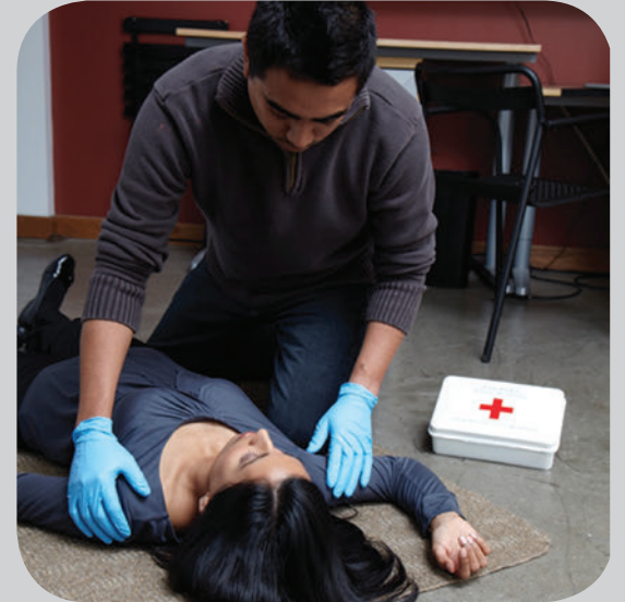
ਸਰਕੁਲੇਸ਼ਨ (ਖੂਨ ਦਾ ਦੌਰਾ ਜਾਂ ਨਬਜ਼)