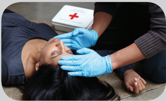
ਏਅਰਵੇਅਜ਼ (ਹਵਾ ਅੰਦਰ ਬਾਹਰ ਜਾਣ ਦੇ ਰਸਤੇ)