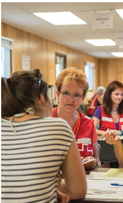
Incendie - Lac-Mégantic - 6 sinistrés