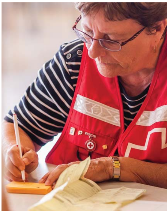
Mise à jour du programme d'aide